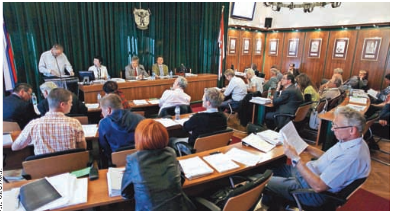
V radovljiškem občinskem svetu sedi 26 svetnikov, ki so se v tem mandatu v štirih letih sestali na 31 sejah; letos na štirih.

ja, imenuje in razrešuje člane sveta za varstvo uporabnikov javnih dobrin ter o drugih zadevah, ki jih določata zakon in statut občine. Strokovno in administrativno delo za potrebe občinskega sveta opravlja občinska uprava. Občinska uprava opravlja upravne, strokovne, pospeševalne in razvojne naloge ter naloge v zvezi z zagotavljanjem javnih služb iz občinske pristojnosti. Občinsko upravo usmerja in nadzira župan, njeno delo pa vodi direktor občinske uprave.