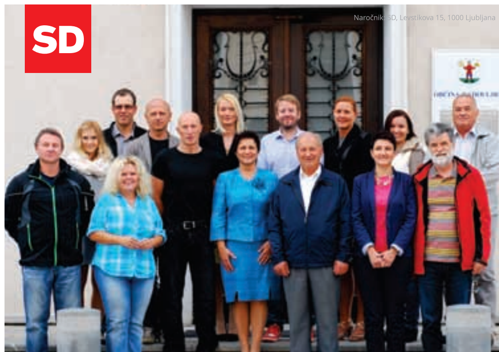
Naročnik: SD, Levstikova 15, 1000 Ljubljana